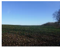
Ackerfläche 4,5 ha bei Löbau Objekt: 1751 02

01877 Bischofswerda OT Großdrebnitz Auktionslimit: 2.499,00 € verkauft für: 4.200,00 €