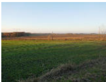
5,3 ha Acker bei Löbau Objekt: 1751 04

01906 Burkau Auktionslimit: 345.000,00 € verkauft für: 625.000,00 €