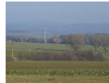
2 ha Acker bei Löbau Objekt: 1751 09

02708 Löbau OT Großdehsa Auktionslimit: 25.000,00 € verkauft für: 58.000,00 €