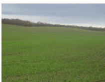
10 ha bester Acker Magdeb. Börde Objekt: 1751 06

01648 Moritzburg OT Boxdorf Auktionslimit: 19.000,00 € verkauft: 56.000,00 €