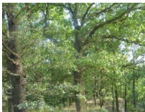
0,5 ha Eichenwald im Spreewald Objekt: 1751 05

01877 Bischofswerda OT Weickersdorf Auktionslimit: 39.000,00 € verkauft: 103.000,00 €