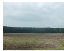
23 ha bestes Ackerland bei Kamenz Objekt: 1751 10

01877 Bischofswerda OT Großdrebnitz Auktionslimit: 3.499,00 € verkauft für: 8.400,00 €