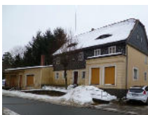
Oberlausitzer WGH - Herrnhut Objekt: 1751 07

39217 Schönebeck Auktionslimit: 199.000,00 € verkauft für: 256.000,00 €