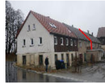
Großes 1-2 Familienhaus bei BIW Objekt: 1751 08

02708 Löbau OT Rosenhain Auktionslimit: 1.500,00 € verkauft für: 3.500,00 €