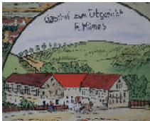
Großer hist. Gasthof bei BIW Objekt: 1751 03

02708 Löbau OT Carlsbrunn Auktionslimit: 9.500,00 € verkauft für: 22.000,00 €